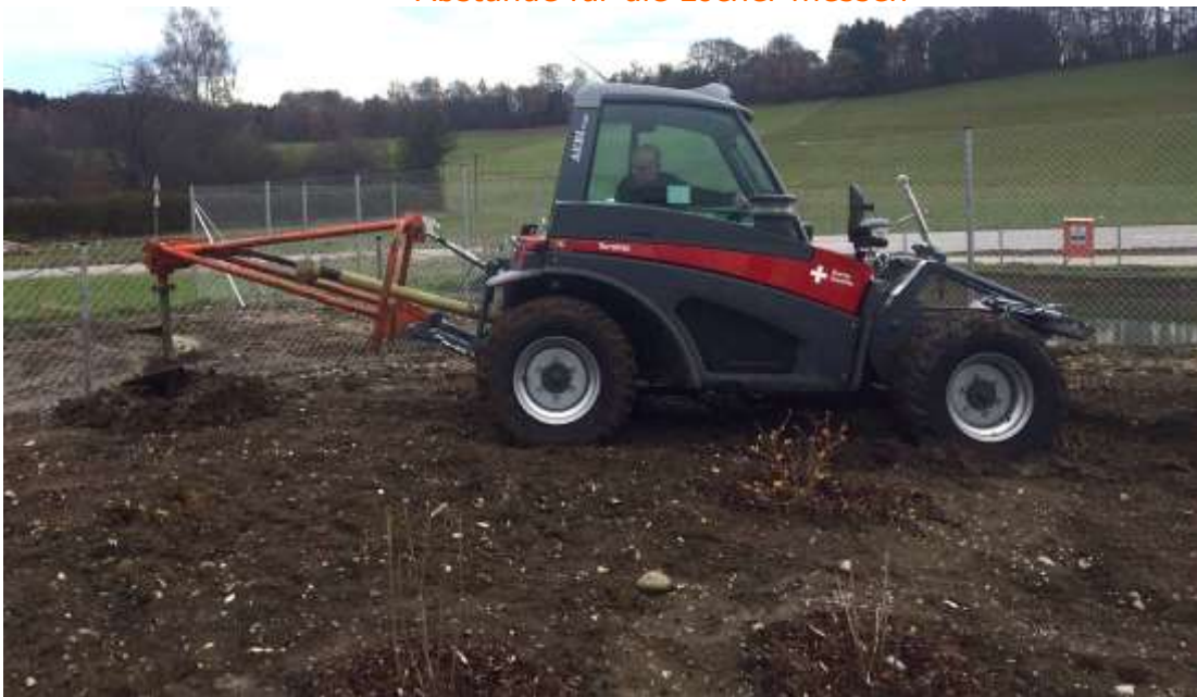
Harald Kalinke bohrt nach

Die Testbohrungen verliefen jedenfalls erfolgreich, die Pflanzlöcher können gebohrt werden. Die Bäume und Sträucher wurden bereits bestellt.. Am 3. Dezember wird dann gemeinsam angepackt.