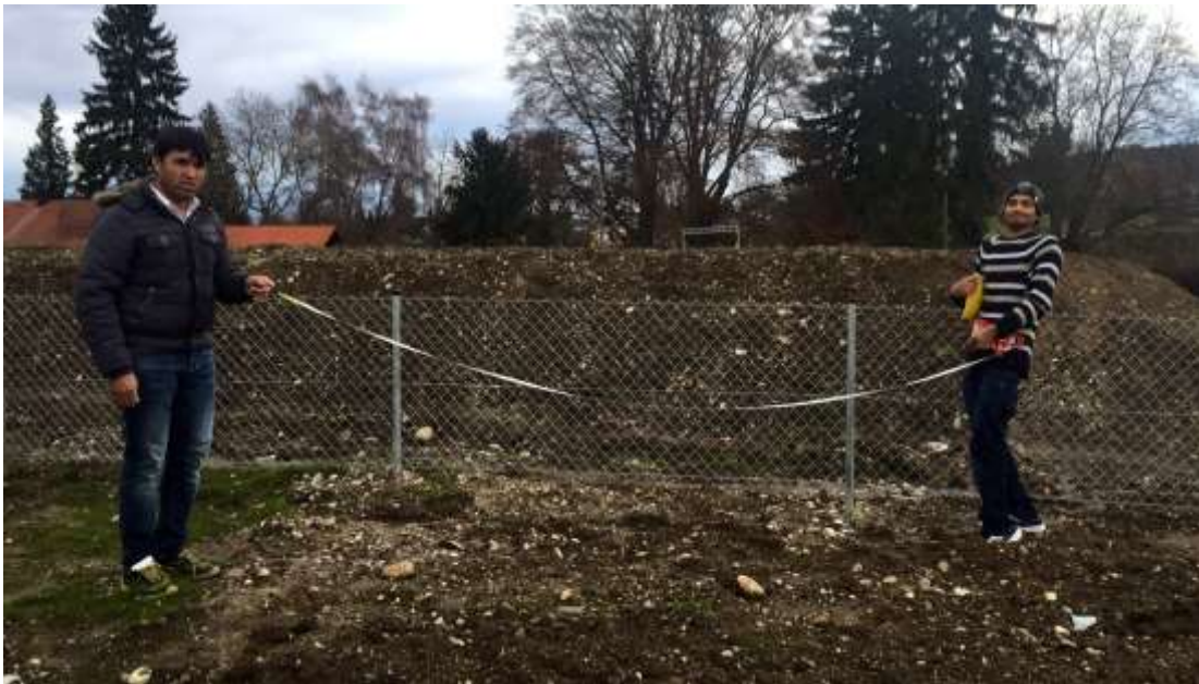
Abstände für die Löcher messen