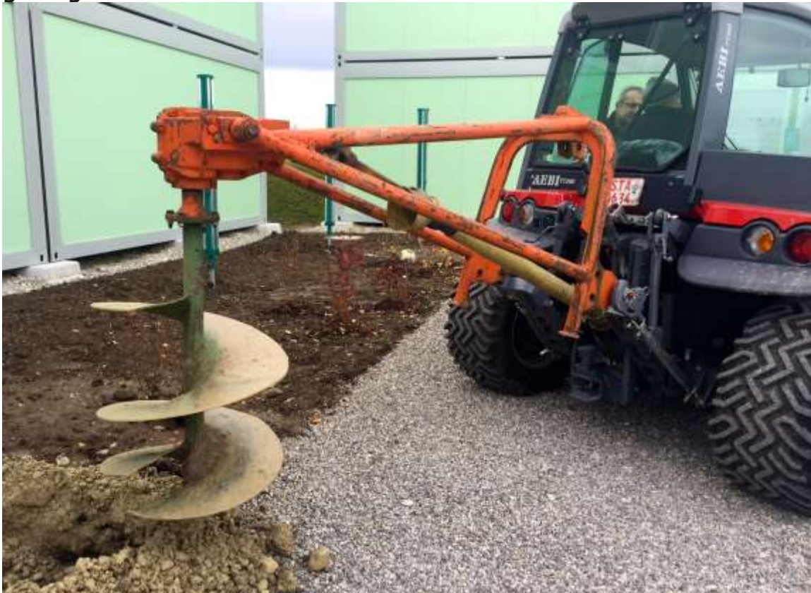
Der Erdbohrer – mit Landschaftsplaner Stefan Rudolf und Gemeinderat Harald Kalinke

Am 3.12. soll die Containeranlage in Berg in einer großen gemeinsamen Aktion bepflanzt werden. Heute wurden schon erste Probebohrungen getätigt.